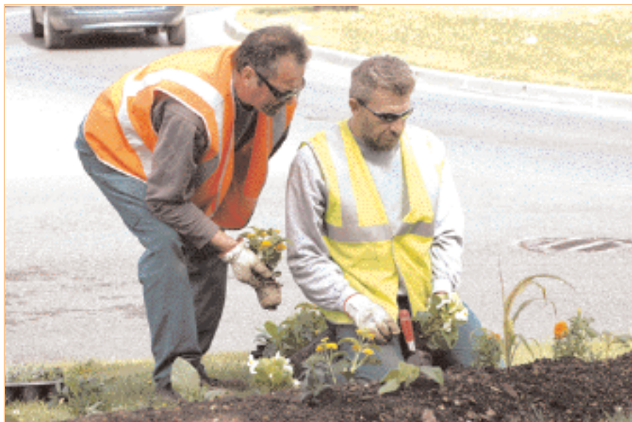
Les jardiniers de la ville

tre technique municipal, il y a trente-et-un véhicules légers, deux camions-benne, deux balayeuses mécaniques, trente-deux fourgons et fourgonnettes.