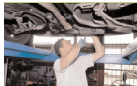
Réparation d'un véhicule du centre technique municipal

Il se compose d'un chef de garage et de deux mécaniciens. Ce service entretient et répare l'ensemble des véhicules de la commune (y compris le matériel des espaces verts : tondeuses, débroussailluses, tronçonneuses, tailles-haies...). Il dispose d'une fosse et de deux astucieux ponts élévateurs à deux et quatre colonnes. Les agents effectuent toutes sortes de réparations sur tous types de véhicules (de la berline au fourgon) et préparent les véhicules au contrôle technique. Pour la protection des hommes, le garage est équipé d'un dispositif d'évacuation des gaz d'échappement. Au cen-