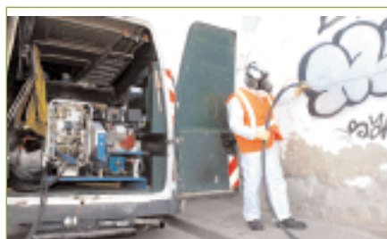
Le service anti-graffiti.

L'entretien de la ville s'effectue de manière manuelle et mécanique à l'aide de deux balayuses qui effectuent douze circuits de nettoyage différents. L'entretien mécanique vient en renfort du