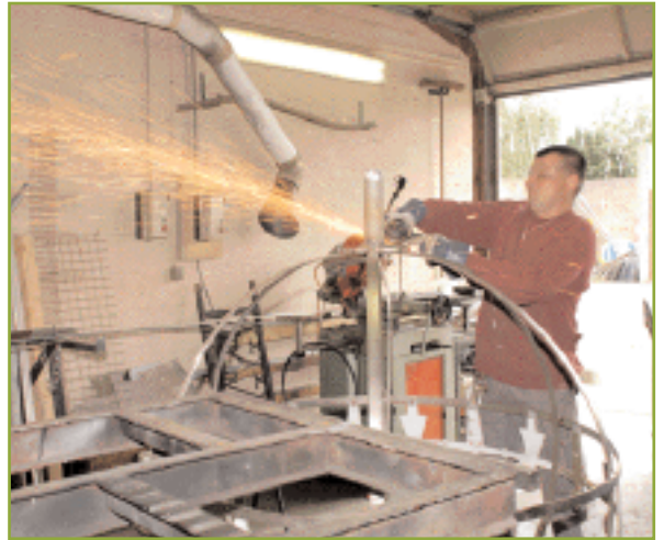
Atelier de serrurerie au centre technique municipal

à la disposition des Combs-la-Villais dans différents domaines tels que l'instruction des autorisations de voirie qui vont de la création des bateaux sur les trottoirs, à la pose de bennes sur le domaine public devant chez soi... Enfin, hors du lieu même du Centre Technique Municipal, de nombreux agents des services Techniques travaillent sur le terrain, dans les domaines de la voirie, du bâtiment, des parcs et jardins et de la mécanique. Sans eux, rien n'est possible.