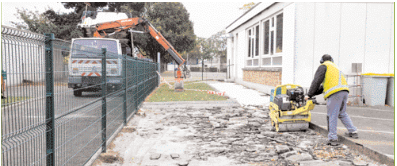
Un agent du service Voirie

Le Centre technique municipal regroupe 70 agents répartis en différents corps de métiers. Il se situe non loin de la zone de l'Ormeau, 8 rue L. et A. lumière. Le CTM s'organise de la manière suivante : le service voirie, le service bâtiment, le service mécanique, le service logistique et le service espaces verts.