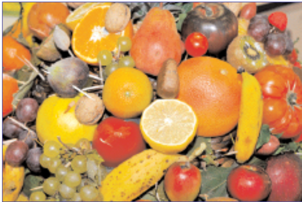
Manger des fruits et des légumes c'est essentiel pour la santé !

LA COMMUNE PARTICIPE À LA SECONDE OPÉRATION « Mouv'eat » pilotée par les Eco Maires, autour du thème de l'accessibilité des publics précaires aux fruits et légumes et à l'activité physique. Le temps fort de cette opération a déjà été engagé pendant la semaine