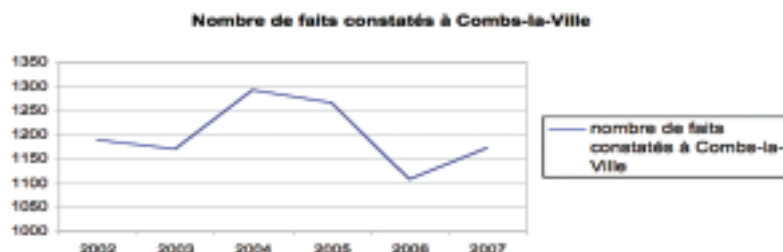
Fig. 1 : évolution des faits constatés par la police nationale

ports. La majorité des mis en cause dans ce type de faits sont des mineurs. Le commissaire relève que le nombre de mis en cause du sexe féminin s'accroît. Dans le cadre de la délinquance sur la voie publique, les véhicules demeurent la cible principale qu'il s'agisse de vols d'accessoires, vols à la roulotte ou vol de véhicules.