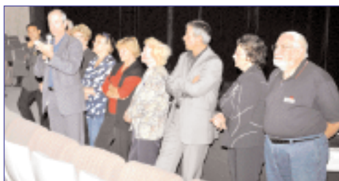
Le lundi 13 octobre la semaine été officiellement ouverte par le député-maire Guy Geoffroy au cinéma La Coupole pour la projection du film La fille de Monaco d'Anne Fontaine.

Tout un programme d'animations était organisé en l'honneur des Seniors de la commune lors de cette semaine nationale.