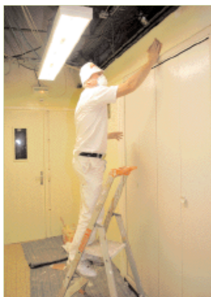
Peintre de la ville

balayage manuel. Une équipe effectue le ramassage des corbeilles à papier, l'entretien des sentes (petites voies), des cours d'écoles, de certaines zones de Combs-la-Ville comme le centre ville, et le ramassage des dépôts sauvages. On compte 151 corbeilles à papier sur Combs-la-Ville avec un ramassage effectué trois fois par semaine. Pour les chiffres, hors dépôts sauvages, les agents