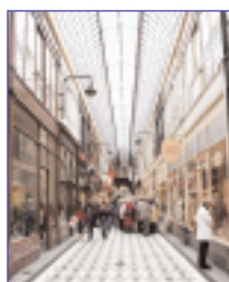
Le mercredi 15 octobre la sortie à Paris était destinée aux passages couverts et aux jardins du Palais Royal.