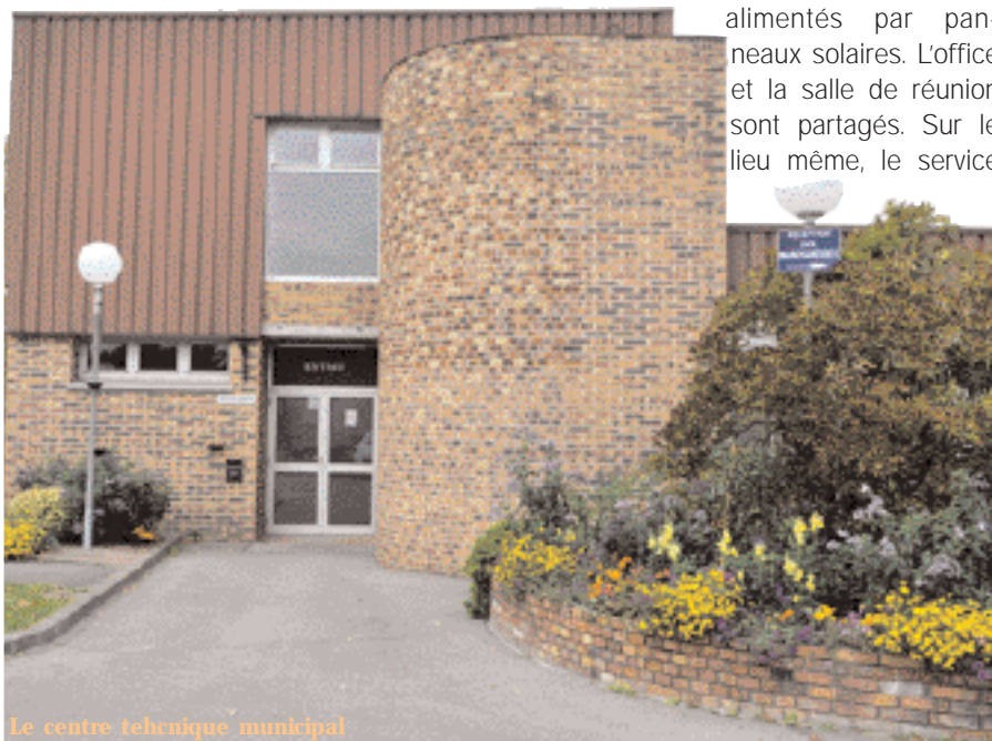
Le centre technique municipal

plombiers, de serruriers... disposent de tout le matériel nécessaire à leur bon fonctionnement. Les services Techniques de la Ville s'organisent en différents secteurs : service voirie, atelier auto, service