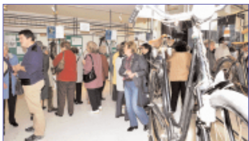
Le jeudi 16 octobre à Moret sur Loing, le musée du vélo et celui du sucre d'orge ont satisfait tous les intérêts : histoire et gourmandise !