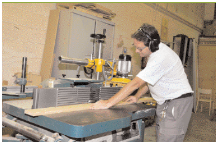
L'atelier de menuiserie de la commune.

ramassent entre 200 à 300 kg de déchets par jour. Combs-la-Ville c'est 74 km de voirie, 95 km de trottoirs.