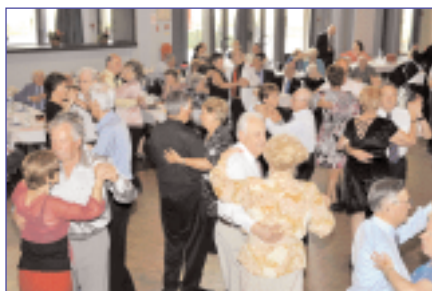
Le vendredi 17 octobre traditionnel thé dansant l'après-midi avant...