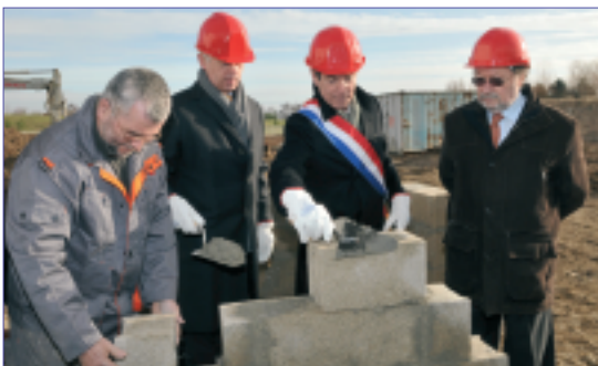
La première pierre du futur CEF a été posée le 22 janvier 2010.