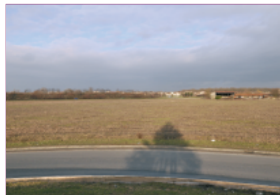
Une partie du site du futur Écopôle sur Combs-la-Ville.

L'Écopôle s'inscrit dans la suite logique de ce qu'a mis en place Combs-la-Ville sur sa zone d'activités de la Borne Blanche avec la Charte de Haute Qualité Environnementale et dont l'entreprise Samada, est l'un des exemples probants. Site pilote, soutenu par l'Etat, et inscrit dans la politique d'Eco-région, l'Écopôle de Sénart se développe sur trois communes : Combs-la-Ville (entrée de ville par la Zone Economique de l'Ormeau sur l'espace qui intègre la ferme en ruine), Lieusaint et Moissy Cramayel. Il s'étend sur 300 hectares réparti sur plusieurs parcs d'activités : Chanteloup, Le Charme et Les Portes de Sénart. Les deux dernières zones d'aménagement concerté