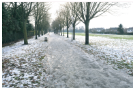
Le parc central sous la neige

nique de recépage sur certaines haies vétustes permet de rajeunir les plantes et évite les tailles les premières années de repousse. La totalité des produits de tontes des gazons et des feuilles mortes