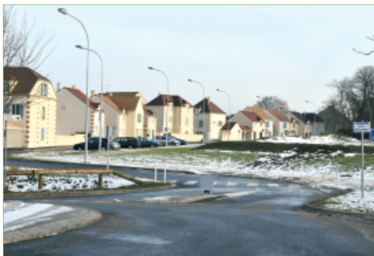
La réhabilitation de la Ferme des Copeaux lancée en 2007 par la construction de logements de qualité donnent une image valorisante à l'entrée Nord-Est de la ville.

ainsi du projet d'aménagement « Qualité Environnementale » qui a permis de retrouver une centralité urbaine, axée sur la construction de l'Hôtel de ville (qui sera un jour alimenté en biogaz grâce à la proximité de l'usine de méthanisation du SIVOM) tout en préservant les caractéristiques du site et de l'espace classé