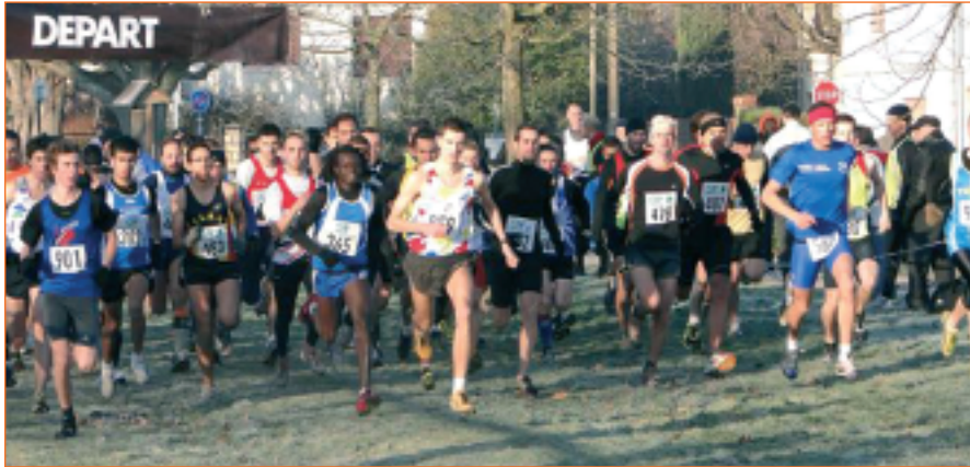
461 coureurs étaient présents pour le Cross de Sénart.

Le cross de Sénart a été couru par plus de 450 courageux. Malgré le froid, tous les participants ont pris du plaisir à parcourir le site de la borne blanche.