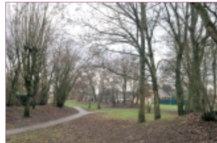
Le parc de Châtillon

La gestion différenciée favorise le rétablissement des équilibres biologiques et la protection de la biodiversité. Elle permet en outre d'économiser des fluides de toutes natures tels que l'eau et le carburant et diminue l'utilisation de produits chimiques. Le service applique des mesures permettant l'économie d'eau d'arrosage. L'installation d'arrosage automatique intégré permet l'arrosage aux périodes les moins chaudes évitant le phénomène d'évaporation, ainsi qu'un