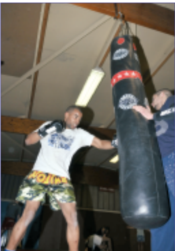
Un atelier boxe est ouvert au PAJ

Pôle Animation Jeunes (PAJ) – 16-25 ans : 01 60 60 03 68 www.clic-la-ville.fr