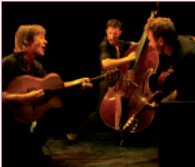
Le trio Samarabalouf

Samarabalouf est un groupe de jazz acoustique manouche fondé en 2000, originaire d'Amiens. Ce trio a déjà donné des centaines de concerts en France et à l'étranger et se produira le jeudi 11 février 2010 au Château de la Fresnaye.