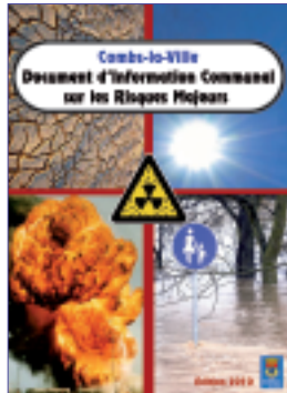
Le Document d'Information Communal sur les Risques Majeurs

VOUS AVEZ TOUS REÇU LA VERSION CONDENSÉE - plus pratique - du DICRIM. Il s'agit d'un document d'information qui doit être mis en place dans toutes les communes. Il permet de recenser un certain nombre de risques environnementaux et technologiques et d'indiquer à la population la conduite à tenir si le risque en question devient réalité. À Combs-la-Ville nous avons recensé huit risques potentiels : les mouvements de terrain, les inondations, les risques météorologiques (canicule, tempête, grand froid, verglas...), les risques industriels, les risques lors de transport de matières dangereuses, les fuites de gaz, les feux de forêts et la pollution atmosphérique. Mais attention nous avons également indiqué par un petit triangle vert, orange ou rouge, le niveau d'importance du risque sur