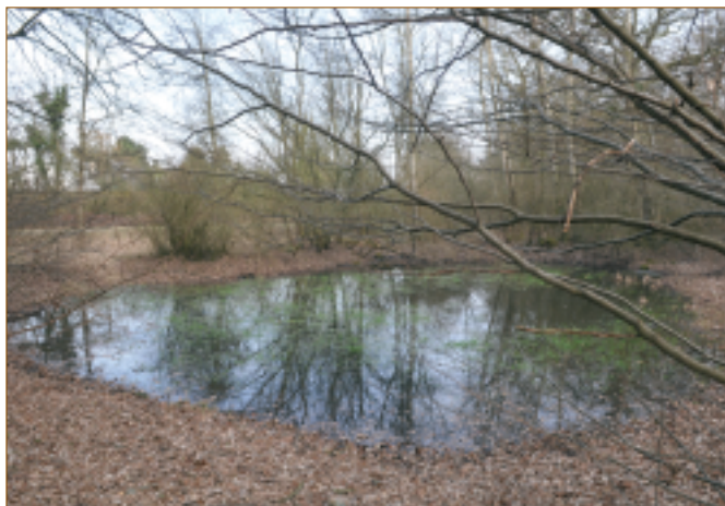
Cette mare est située à l'entrée de la forêt de Sénart

Avec l'arrivée de l'eau potable au robinet,