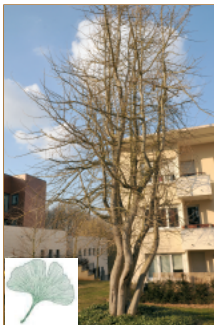
Arbres aux quarante écus (parc Menchy). Il peut vivre jusqu'à 3000 ans. Il s'agirait du premier arbre à avoir repoussé dans la zone touchée par l'explosion de la bombe nucléaire à Hiroshima.