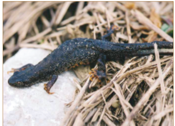
Le triton crêté

Sa faible profondeur induit un réchauffement rapide de l'eau et une luminosité importante, ce qu'apprécient de nombreuses plantes qui s'installent sur les berges, à la surface ou sous l'eau. Les variations du niveau d'eau selon les conditions météorologiques sont un facteur supplémentaire de diversité avec l'installation de plantes spécifiques à ces conditions. Cette grande variété floristique favorise la présence de nombreux animaux qui utilisent la mare comme point d'eau, terrain de chasse (mammifères, oiseaux) ou sites de reproduction. On note la présence remarquable au printemps, des grenouilles comme la Grenouille verte ou la Rainette verte, des