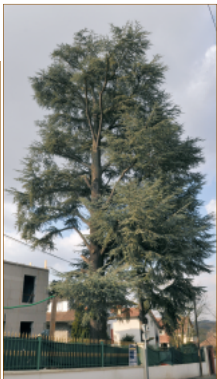
Cèdre (angle avenue de la République / avenue de la Chesnaie).