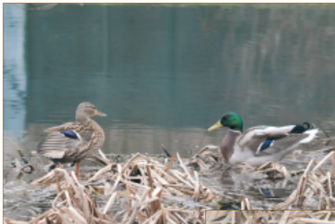
Une poule d'eau et un couple de canards col vert photographiés récemment sur la mare à l'Ancre de Combs-la-Ville.

Les mares sont d'autant plus intéressantes qu'elles sont présentes en grand nombre sur le territoire français, et reliées entre elles par des fossés, chemins, haies ou franges boisées, formant un réseau de milieux, ou des corridors biologiques, essentiel pour la circulation et la pérennité des espèces.