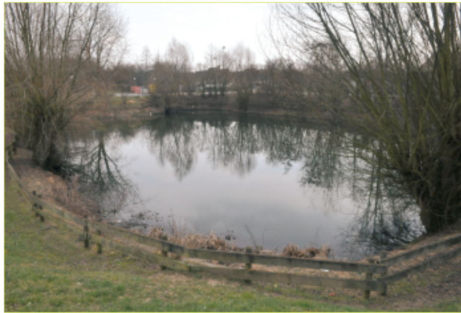
La mare à l'Ancre sur la route de Moissy, au milieu du plateau.

par la commune comme thème fédérateur de l'année et sera mis à l'honneur à l'occasion de la semaine du développement durable qui aura lieu du 1 er au 7 avril 2010. Nous vous proposons un zoom sur la thématique des mares suivi d'une découverte des arbres remarquables présents au coeur de la ville.