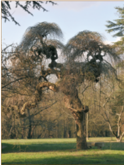
Sophora du Japon pleureur (10, rue Sommeville). Cet arbre est originaire d'Asie. Il supporte les gelées jusqu'à moins 15°C mais n'aime pas les vents froids. Il produit des fleurs blanches en grappe.

Depuis l'an 2000, l'association A.R.B.R.E.S (Arbres Remarquables : Bilan, Recherche, Études et Sauvegarde) a attribué le label « Arbre Remarquable de France » à des municipalités qui oeuvrent pour la sauvegarde d'un arbre exceptionnel situé sur leur commune. Les arbres exceptionnels par leur âge, leurs dimensions, leurs formes, leur passé ou encore leur légende sont appelés arbres remarquables. Ces ligneux représentent un patrimoine naturel et culturel qui doit être conservé. Combs-la-Ville compte sur son territoire six arbres dits "remarquables". Les voici en images, vous ne manquerez pas de les remarquer lors de vos balades à travers la ville.