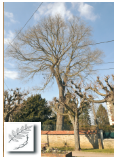
Sophora du Japon (4 av. de la République). Originaire de Chine (et pas du Japon !) Il tolère la sécheresse, la chaleur et s'adapte aux milieux urbains.