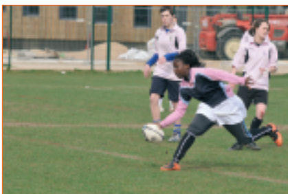
Ici une rugby woman cadette en action