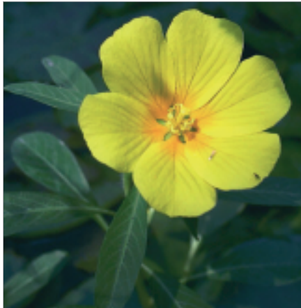
La jussie pousse dans les eaux peu agitées des mares

les mares ont bien souvent perdu leurs fonctions initiales et, avec elles, leur intérêt apparent pour l'homme. Elles sont fréquemment négligées, perçues comme des lieux insalubres, utilisées à d'autres fins moins propices à la biodiversité (décharges) ou simplement comblées. De plus, leur petite taille, le faible volume d'eau qu'elles