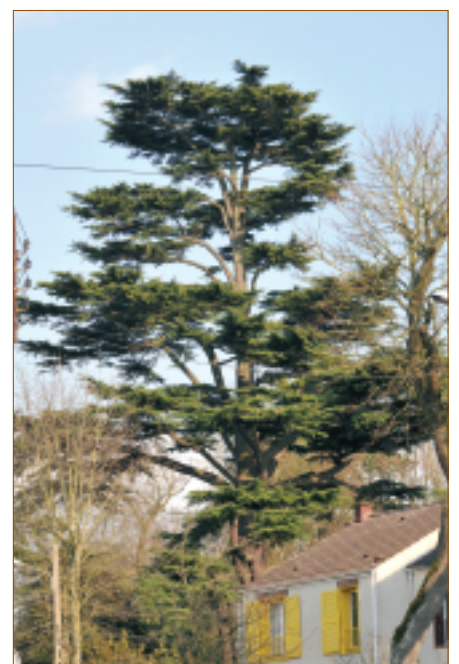
Cèdre (place Claude Tournier / rue Boissière). Originaire du Moyen-Orient et de l'Himalaya, le cèdre est l'arbre symbole du Liban et sa silhouette figure sur le drapeau libanais.