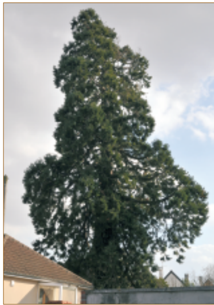
Séquoia géant (13, rue Sommeville). Le séquoia géant détient le record de vie (2000 ans). Les fruits (cônes) du Séquoia géant mettent deux ans à mûrir et restent plus longtemps encore sur l'arbre.