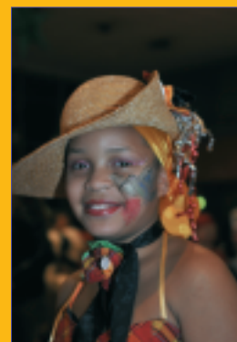
Un déguisement d'enfant en créole