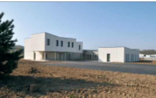
Situé rue de la Borne Blanche, le CEF s'intègre parfaitement dans le paysage.

Les travaux du CEF géré par l'ADSEA 77 se terminent. Avant d'accueillir les 12 jeunes occupants, le CEF vous ouvre ses portes, sans fard et sans tabou les 28, 29 et 30 avril.