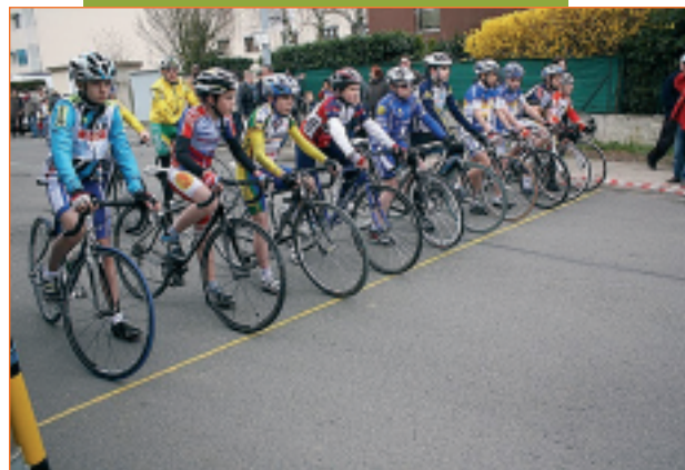
Départ de la course minimes 1

La Pédale Combs-la-Villaise organisait dimanche 13 mars, le Prix des jeunes espoirs, une épreuve qui a réuni pas moins de 124 coureurs qui se sont disputés la victoire dans huit catégories différentes. Les courses se sont enchaînées sur un rythme soutenu. L'après-midi se concluait par la remise des récompenses. La Pédale Combs-la-Villaise, remercie tous les bénévoles qui ont participé à la réussite de cette organisation.