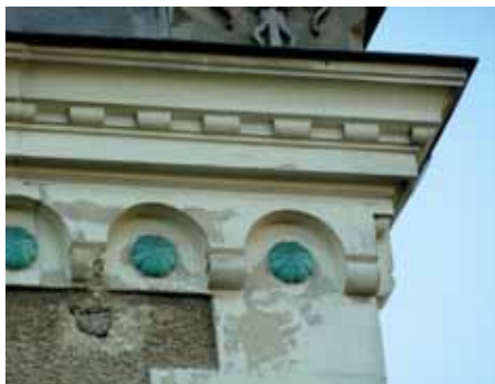
Un soin particulier sera apporté aux médaillons en céramique (bleu vert)

faire l'objet d'une attention toute particulière. Elles peuvent être soumises à de nombreuses agressions telles que la pollution ou le soleil. Les peintures utilisées sont spécifiques à la surface traitée et aux intempéries. Les produits employés sont normés et ne contiennent pas ou peu de substances classées dangereuses (sans odeur, limite les émissions de solvants). Un traitement antirouille sera appliqué par l'utilisation d'une peinture spécifique sur les garde-corps métalliques. La cheminée en brique rouge sera brossée, nettoyée, un traitement hydrofuge sera appliqué. Les gouttières en zinc vont être reprises, les bavettes en zinc défectueuses vont être remplacées.