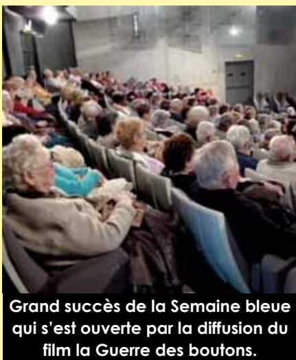
Grand succès de la Semaine bleue qui s'est ouverte par la diffusion du film La Guerre des boutons .