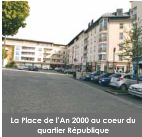
La Place de l'An 2000 au coeur du quartier République

incendie criminel il y a plusieurs années. Ce parking dépend de l'Office Public de l'Habitat 77. Suite aux demandes du Conseil de quartier, la commune a interpellé plusieurs fois l'OPH77 quant à la réouverture de ce parking, voici sa réponse : « ce parking a été soumis à cinq