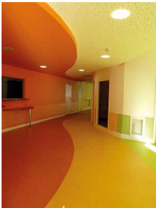
L'intérieur coloré de l'EHPAD

Ces animations pourront donner lieu ponctuellement à des échanges avec les