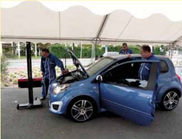
Les 12 et 15 octobre la police municipale a permis à ceux qui le souhaitaient de vérifier gratuitement les optiques de leur voiture.