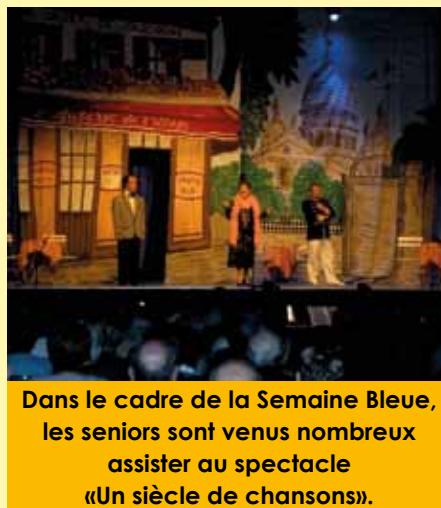
Dans le cadre de la Semaine Bleue, les seniors sont venus nombreux assister au spectacle «Un siècle de chansons».