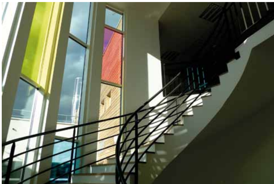
L'escalier aux vitres colorées à l'intérieur de l'EHPAD

Le Conseil Général peut, sous certaines conditions, participer au paiement du tarif hébergement. Concernant l'Allocation Personnalisée d'Autonomie (APA) à domicile, cette aide financière est convertie en APA d'hébergement dès l'entrée dans la maison de retraite et permet de couvrir le tarif dépendance. Son montant varie selon le niveau de dépendance de la personne accueillie.