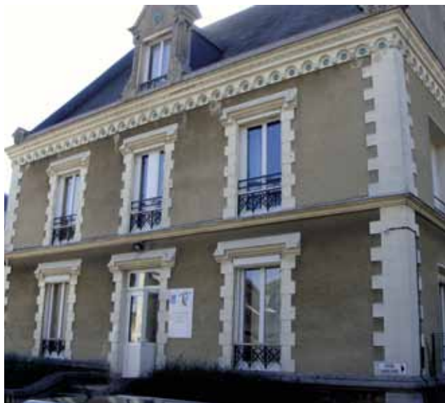
La Villa République retrouvera prochainement son charme d'antan

La Villa République est une ancienne maison bourgeoise datant du XIX ème siècle. Elle bénéficiera bientôt d'un véritable bain de jouvence.