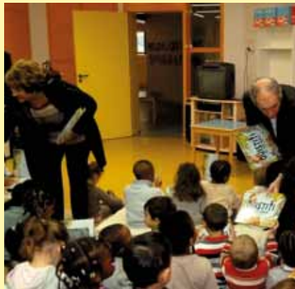
Le 17 octobre remise du livre Ouistiti aux maternelles (ici à l'école des Quincarnelles).