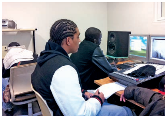
L'atelier MAO permet de créer de la musique sur ordinateur et de réaliser des CD

Les animateurs du Tremplin 16-20 ans vous attendent pour une semaine pleine d'animations du 19 au 23 décembre 2011 de 10h à 12h et de 14h30 à 19h. Au programme : sorties, ciné, ateliers... L'atelier MAO (musique assistée par ordinateur) fonctionnera le matin, les animateurs l'avaient déjà animé pendant les vacances d'octobre, les jeunes ont répondu présent, il est donc reconduit.