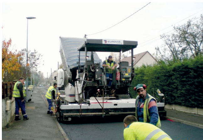
La rue Paul Gauguin a fait peau neuve

La rue Paul Gauguin vient d'être rénovée, la rue de Lieusaint (la partie qui accède au pont des étriviers) le sera début 2012, un marquage au sol rue Jean Moulin alerte sur la traversée possible de la chaussée par des enfants.