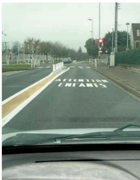
Marquage rue Jean Moulin / rue de Lieusaint

En 2012, un projet de rénovation de la place Gaston Defferre devrait voir le jour, entre autres, pour rénover la chaussée et permettre une meilleure accessibilité. Le projet global sera expliqué dans Rencontre le moment venu.