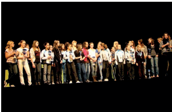
Le CACV gymnastique : club de l'année

En 2010 le meilleur sportif de l'année pour la saison 2009 / 2010 était Moha-