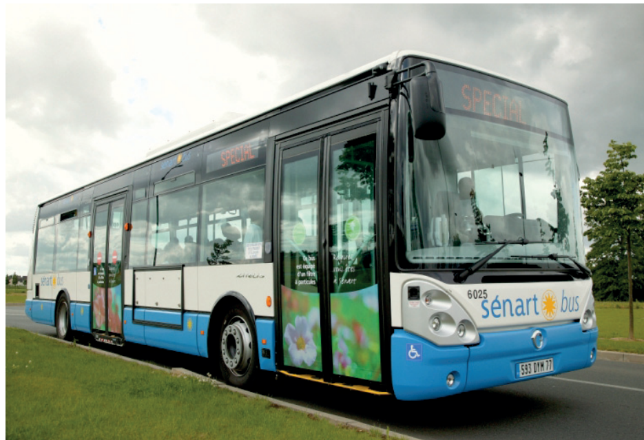
Les Sénart bus sont respectueux de l'environnement

À Combs-la-Ville, les horaires de départ et d'arrivée des bus sont calés en fonction