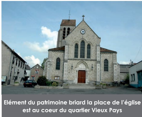
Élément du patrimoine briard la place de l'église est au coeur du quartier Vieux Pays

Soucieux du devenir de la place de l'église, les habitants ont évoqué de ma-