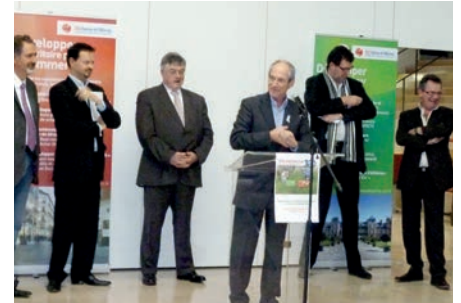
Avec la Chambre de Commerce et d'Industrie, la Chambre des Métiers et la Mutuelle bleue, pour récompenser les commerçants de Combs-la-Ville soucieux du développement durable.

Avec 2012, nous allons renforcer notre dispositif communal, avec la mise en place effective de la vidéo-protection, que certains ont encore la légèreté et l'irresponsabilité de refuser !, avec l'accroissement des moyens de la police municipale malgré le contexte budgétaire très contraint ; avec l'accroissement de notre coordination avec la police nationale dont la nouvelle organisation en «brigade spécialisée de territoire» et en «patrouilleurs» va, en s'affirmant, contribuer à améliorer la situation ; avec un travail de réflexion et