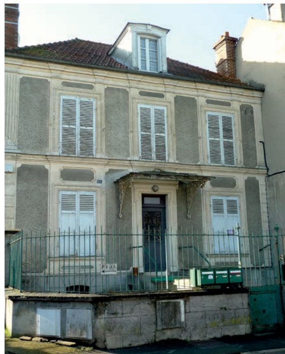
La demeure du 55 rue Sermonoise sera réhabilitée

Cette maison va être réhabilitée dans le cadre de la préservation du patrimoine