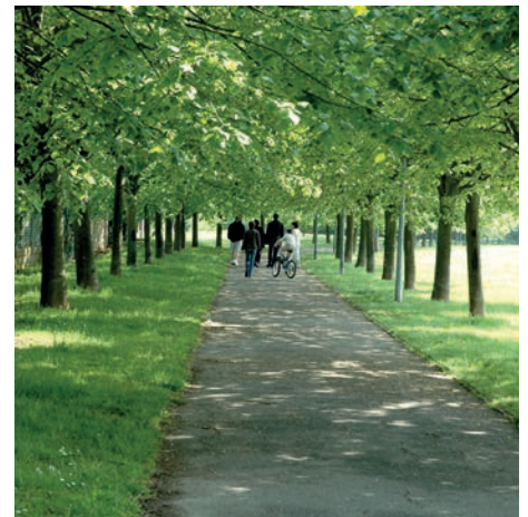
Les arbres du parc central

À Combs-la-Ville, depuis 2005 nous avons planté, cinquante arbres par an en moyenne. Citons le square Idalion, l'espace naturel sensible classé et protégé situé derrière l'Hôtel de Ville, le parc de la Tour d'Aleron, la rue Jean-François Millet, et l'allée des Princes plantée en 1998 sans parler de la Borne Blanche, espace de 6 hectares sur lequel on trouve 13 555 nouveaux arbres plantés.