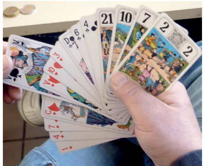
Atouts, «petit», 21, excuse, cavalier... autant de cartes qui rendent le jeu de tarot si particulier !