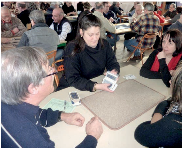
Le jeu de tarot réunit de nombreux passionnés