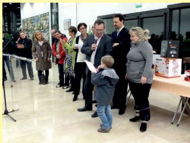
L'association des artisans et des commerçants de Combs-la-Ville 2A2C, en partenariat avec la Chambre de Commerce et d'Industrie et la commune, a procédé à la remise des prix des bougies décorées et de l'objet insolite le vendredi 13 janvier 2012 à l'hôtel de ville. Le public nombreux avait fait le déplacement pour admirer les 180 bougies décorées. De beaux lots ont été distribués par les commerçants, tous les participants ont reçu un lot de consolation.