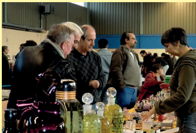
Le 15 janvier, le Salon des collectionneurs a connu encore une fois un grand succès avec de nombreux visiteurs et une soixantaine d'exposants.