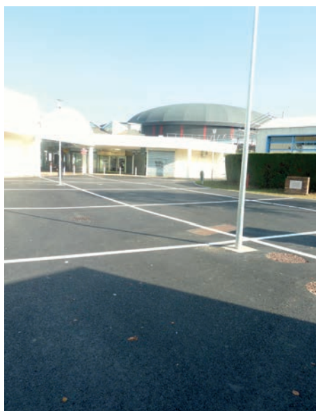
Place Gaston Defferre : des bandes blanches pour casser la monotonie du bitume !

s'inscrit dans la continuité de celui déjà existant sur la place du 14 juillet derrière la Coupole.