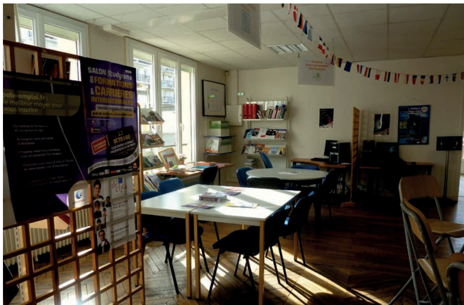
La salle de documentation du BIJ, vous y trouverez un grand choix d'informations avec l'aide d'un informateur jeunesse si vous le souhaitez.

Il abrite une documentation variée, régulièrement remise à jour, traitant de sept grandes thématiques : organisation