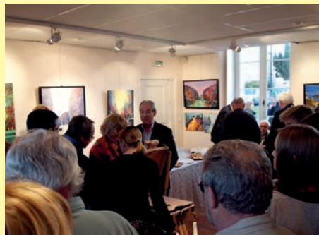
Il y avait beaucoup de monde lors du vernissage du Salon d'automne de l'AAPS qui se tient jusqu'au 4 novembre au Château de la Fresnaye.