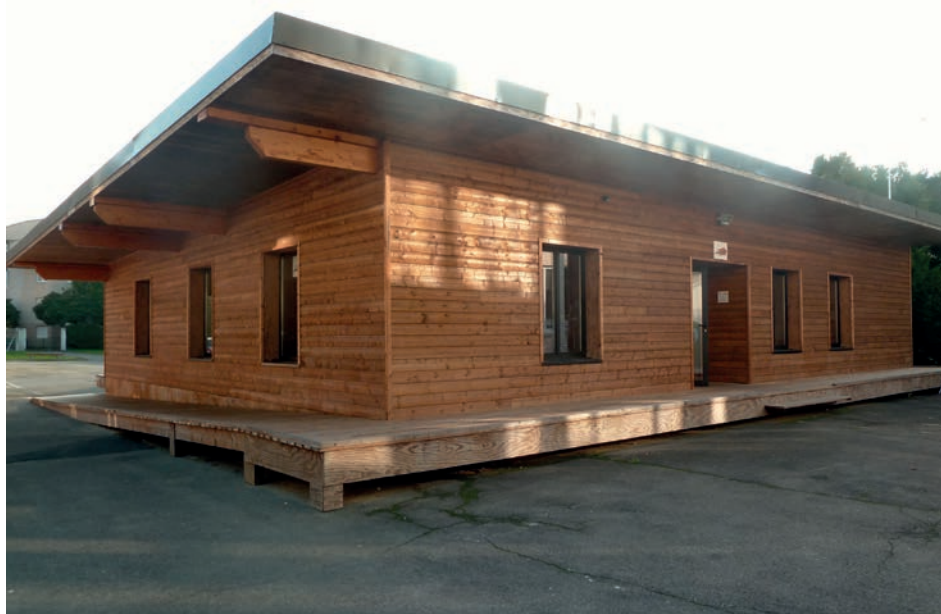
Le Tremplin 16-20 ans conçu de plein pied...

L'animatrice du Conseil Communal des Ados (CCA) est située au Bureau Information Jeunesse. Elle y travaille avec les jeunes élus du CCA aux projets qu'ils souhaitent développer pour l'année.