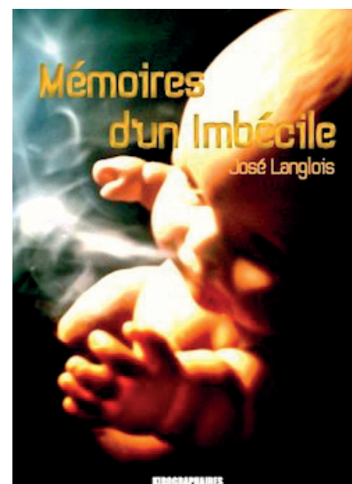
Mémoires d'un imbécile - José Langlois - aux éditions Kirographaires. Le livre est disponible à la médiathèque.