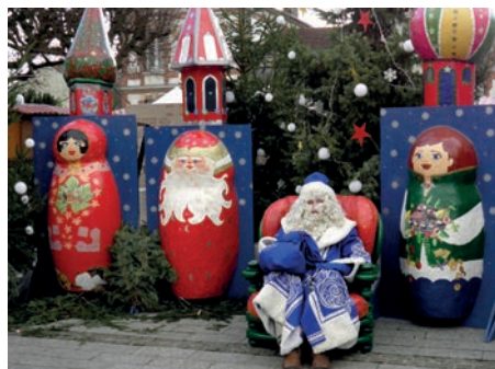
L'an dernier, le marché de Noël était Russe !