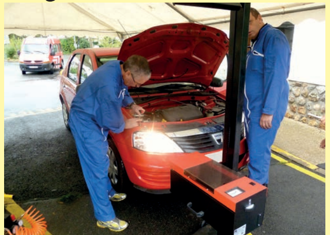
Une fois n'est pas coutume, sécurité routière oblige, la police municipale a contrôlé gratuitement les optiques des véhicules de ceux qui les ont apportés les 17 et 20 octobre.