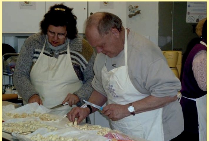
La Semaine du Goût et la semaine Bleue ont fait cause commune et les seniors ont ouvert leur semaine en préparant à Trait d'Union des mets épicés, thème de la Semaine du Goût.