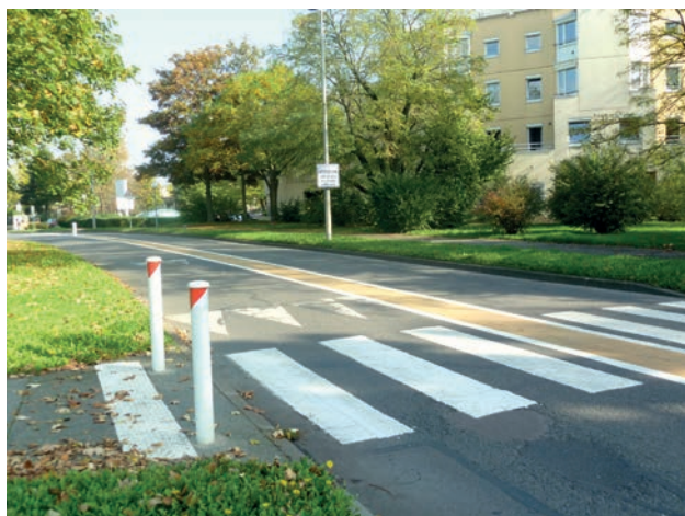
Marquage central rue Pablo Picasso pour rétrécir les voies et inciter les automobilistes à ralentir

Attendu depuis longtemps par le Conseil de quartier Prévert, le marquage au sol aux abords du centre commercial et de la rue Pablo Picasso a été refait.