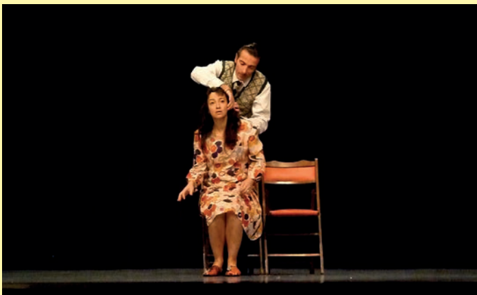
Le mercredi 17 octobre dans le cadre de la Semaine bleue, la pièce «Dans tes bras» a permis d'alimenter une réflexion sur le rôle des aidants face à la dépendance.