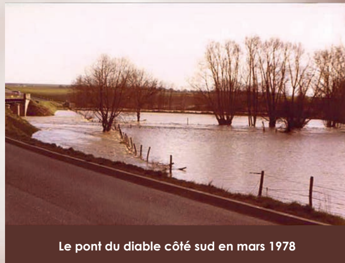
Le pont du diable côté sud en mars 1978

Le Plan Particulier des Risques d'Inondation (PPRI) - qui fait partie du Plan Local d'Urbanisme - est consultable au service Urbanisme de la mairie. Il indique les zones inondables - donc inconstructibles - sur la ville. À Combs-la-Ville, elles sont peu nombreuses. On y trouve le chemin de l'Isba, et une petite partie de la rue de Vaux la Reine vers la passerelle.