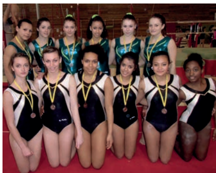
Les collégiennes et lycéennes de Combs-la-Ville, 2ème du championnat académique de Gymnastique artistique d'Ile de France

Le 27 février dernier à Noisy le Grand s'est déroulé le championnat académique de Gymnastique Artistique d'Ile de France, qualificatif pour le Championnat de France UNSS. Ce championnat réunit les meilleures sections «sports-études» de la région. Combs-la-Ville présentait 4 équipes (2 collège et 2 lycée) dans 2 catégories (excellence N1 et N2). En N1, le collège (Champion de France 2012) termine 2ème derrière Meaux à seulement 0.900 pts ainsi que le lycée (derrière Meaux également !) à 0.200 pts... En N2, le collège prends la 4ème place et le lycée la 2ème derrière Pontault Combault.