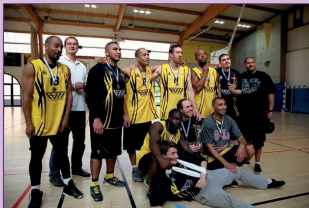
L'équipe Senior masculine de basket réalise un sans faute !

La qualité principale d'un bon président est l'ambition pour son club, la volonté de l'amener le plus haut possible, et être à l'écoute.