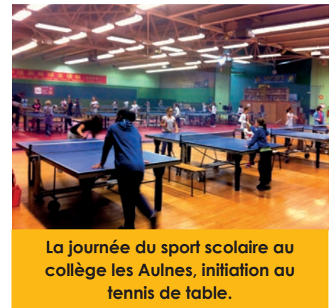
La journée du sport scolaire au collège les Aulnes, initiation au tennis de table.

Mercredi 18 septembre 2013 avait lieu la journée du sport scolaire. Chaque année, en début d'année scolaire, l'emploi du temps des collégiens est dédié à la promotion du sport scolaire. Au collège les Aulnes, tous les élèves ont pu découvrir les différentes activités sportives propo-