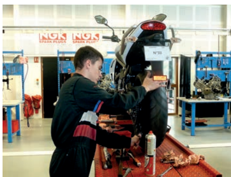
Au lycée des métiers Prévert, dans l'atelier les élèves sont concentrés pour remporter le titre de Meilleur Apprenti de France.

L'association des meilleurs Ouvriers de France a organisé le 4 octobre 2013, le concours national du Meilleur Apprenti de France dans la spécialité maintenance en motocycles. Ces épreuves nationales se sont déroulées au lycée des métiers J. Prévert. Ce concours final vise, entre autres, à affirmer la personnalité de l'apprenti, à développer l'esprit d'initiative et de créativité, il met aussi en valeur les établissements d'enseignement professionnel. Ainsi, sept élèves (qui auparavant ont passé avec succès les finales départementales et régionales) venus de