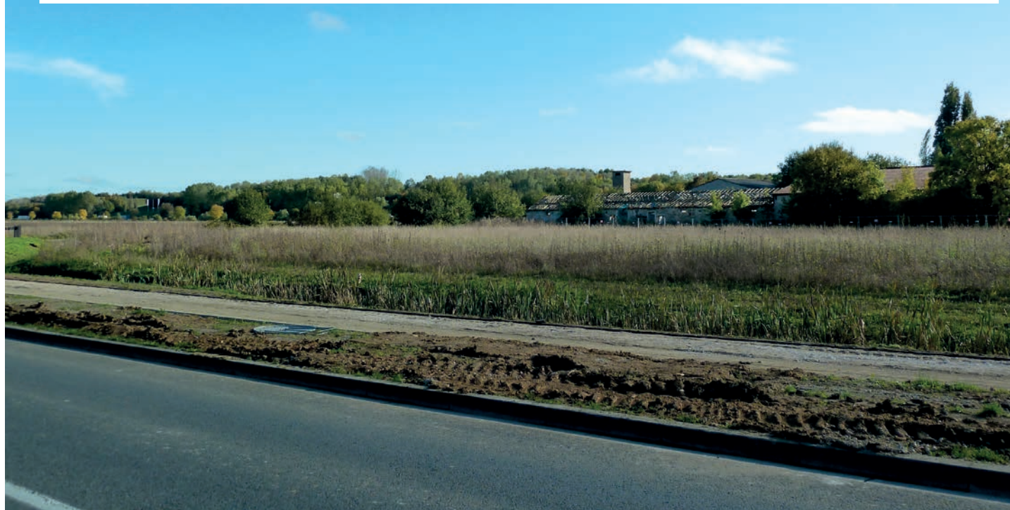
Voici l'emplacement du futur Ecopôle sur Combs-la-Ville.

La signature d'un Contrat de Développement Territorial entre les élus de Sénart et l'État, fin 2013, va marquer l'entrée officielle de Sénart dans le Grand Paris. Une opportunité de développement est ainsi offerte au territoire, en matière d'aménagement et d'économie.