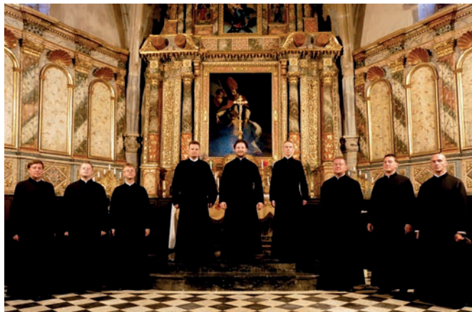
Le chœur Saint-Alexandre Nevsky de Saint-Pétersbourg en concert à Combs-la-Ville