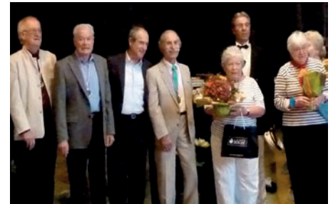
Lors de la clôture de la Semaine bleue.

Et j'assume totalement la décision que j'ai prise avec gravité et conscience de ne pas accepter la scolarisation d'enfants de ce campement, car si je l'avais fait j'aurais cédé aux mensonges de gens prétendant indûment être résidents réguliers de notre terrain d'accueil de gens du voyage. J'aurais surtout entretenu l'illusion