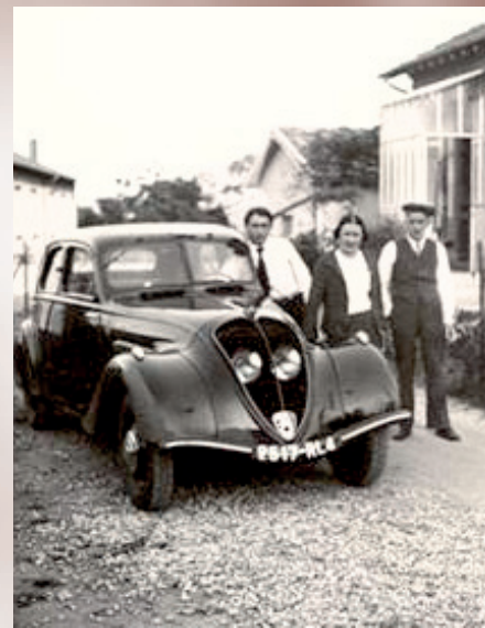
Cette photo a été prise en 1938, 10, rue des Écoles, à Combs-la-Ville.