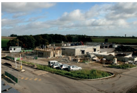
Déchetterie de Varennes-Jarcy : les travaux seront terminés en avril 2014

kage du verre, et un espace couvert pour le sel de déneigement sont déjà opérationnels. D'autres bâtiments restent en-