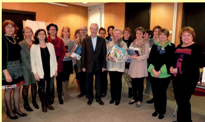
Le 17 janvier dernier, une douzaine de beaux livres ont été remis, comme chaque année, aux bibliothèques des écoles maternelles, par les membres du comité de la Caisse des Écoles pour un montant total de plus de 1000 euros.