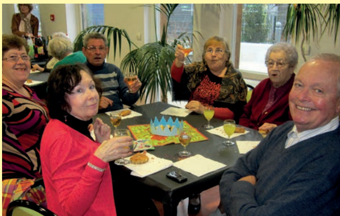
Le 19 janvier l'ensemble des seniors qui participent aux différents ateliers proposés et les résidents du Pré aux Tilleuls (70 personnes) étaient réunis salle d'animations du Pré aux Tilleuls pour partager la galette des rois et inaugurer la salle d'un beau panneau en mosaïque avec inscrit «Le Pré aux Tilleuls».