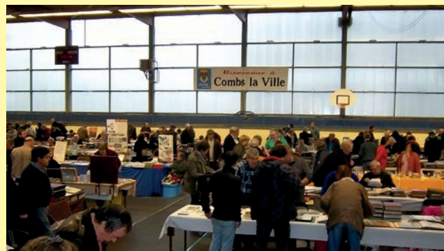
Le 19 janvier, le gymnase Paloisel accueillait le 28ème salon des collectionneurs. Organisé par l'association Philatélique de Combs-la-Ville, il a permis à de nombreux visiteurs petits ou grands de fureter dans les étalages très variés des 73 exposants et ainsi de se laisser tenter...