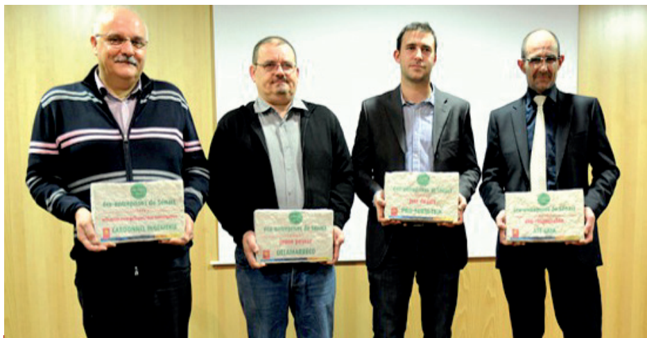
De gauche à droite : les responsables de Cardonnel, Dalamarréco, Pro-Form-Tech et ATF Gaia lors de la remise du Trophée des Eco Entreprises de Sénart.

Au delà de la distinction honorifique, matérialisée par un trophée spécialement créé pour Sénart, les lauréats bénéficieront d'une action de communication ciblée et d'un accompagnement technique.