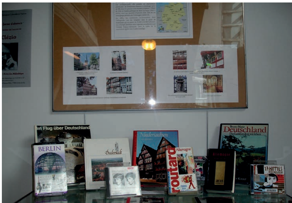
Une table de présentation d'ouvrages sur l'Allemagne proposée lors des Journées du Patrimoine sur le thème du jumelage.

Maîtriser la lecture permet d'apprendre, de comprendre, de poser une réflexion, de se situer dans la société, d'évoluer, de se faire plaisir, de s'évader, de rêver en un mot construire chaque citoyen que nous sommes, la lecture peut changer des vies, jouer un rôle dans la détermination de l'avenir de notre société.