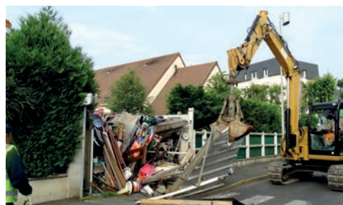
Nettoyage du terrain rue des Brandons

Au terme d'une longue procédure, la commune a obtenu le droit de vider le terrain du particulier rue des Brandons qui mettait à mal la salubrité publique.