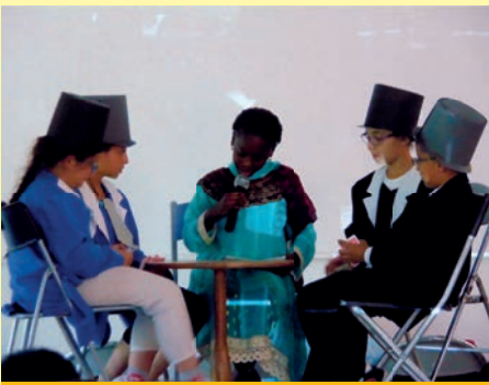
Avec Trait d'Union, les enfants du soutien à la scolarité ont donné un spectacle sur le thème du Tour du Monde en 80 Jours.