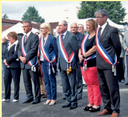
Après le 18 juin, les élus et les Combs-la-Villais ont célébré le 14 juillet.