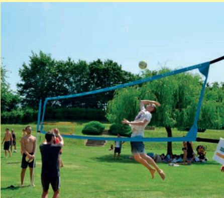
Une partie de Beach Volley sous le soleil pendant la fête du sport le samedi 7 juin 2014.