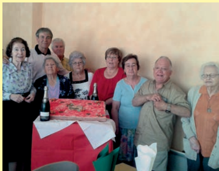
Les seniors ont fêté les anniversaires du trimestre (avril, mai, juin) au restaurant scolaire le Paloisel.