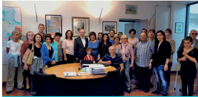
Lors de la visite des Chypriotes en juillet.

Parce qu'il est bon de flâner à la belle saison sur les quais de la Seine, et que l'été indien se glisse parfois avec douceur sur notre région, les délégations de nos villes jumelles choisissent ces périodes de « beau temps » pour nous rendre visite... et constatent souvent que la météo n'est plus ce qu'elle était ! Mais le plaisir est toujours partagé de se retrouver pour un pique-nique, sous la pluie, ou une bonne bière, au coin du feu.