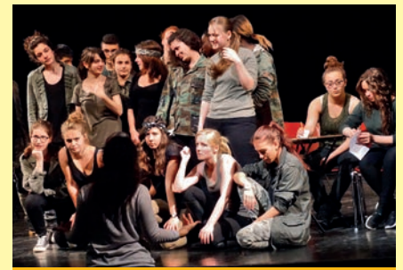
L'équipe de la rédaction du journal lors d'un stage photo a eu la chance d'assister aux répétitions d'une pièce de théâtre par les élèves de l'option bac théâtre du lycée Galilée à la Coupole.