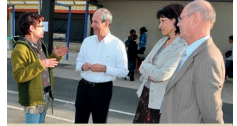
Le 2 septembre le Maire sera dans les écoles pour la rentrée scolaire

Tout ceci justifie pleinement l'extrême prudence et la grande sagesse d'une