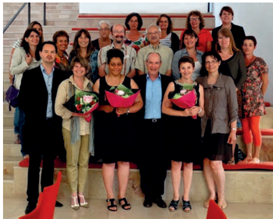
Les enseignantes sur le départ honorées en mairie

Les effectifs dans les écoles sont stables,