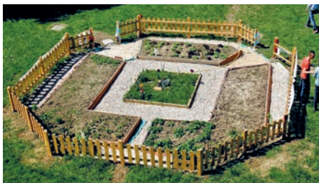
Le jardin biologique du collège les Aulnes a été inauguré le 11 juin.