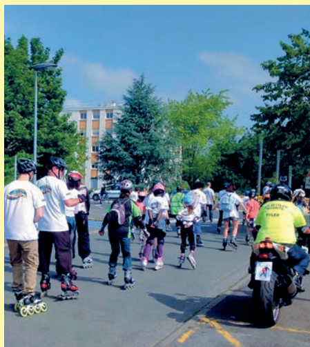
Forte de son succès, la «rando-rollers» est l'événement incontournable de la fête du sport. Les amateurs de glisse s'en donnent à coeur joie ce jour là pour patiner librement sur la voie publique avec le soleil en prime !