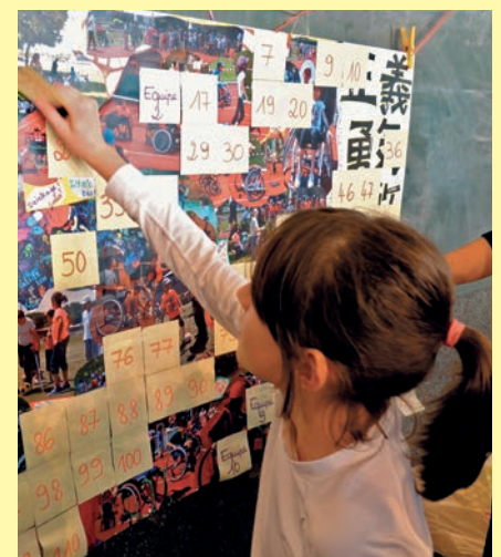
Le vendredi 11 juillet 2014 avait lieu la manifestation «Valide ton sport» qui a réuni les enfants de l'EMS, des accueils de loisirs et de l'Elan 11-15 ans. Les enfants avaient réalisé un poster pour Handisport 77.