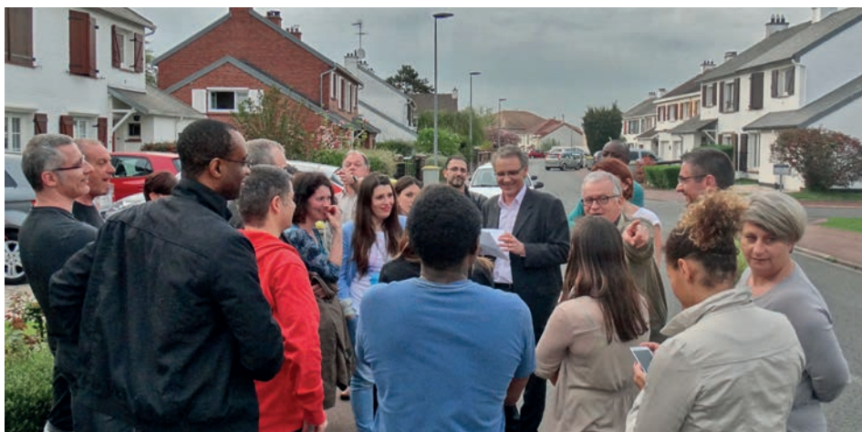
Discussion avec des riverains de l'avenue de la Marrache sur la question du stationnement

de certaines voitures dans la rue. La commune a proposé de matérialiser des places de stationnement le long de la rue (une dizaine) afin de permettre à ceux des riverains dont la configuration de garage avancé pose problème, de garer leur voiture sur ces places clairement définies. Elles seront tracées d'un seul côté afin de ne pas gêner le passage du bus et devraient permettre de «casser» un peu la vitesse. Les places sont situées sur le domaine public et sont à la disposition de tous mais devraient faciliter le stationnement de véhicules qui sont en