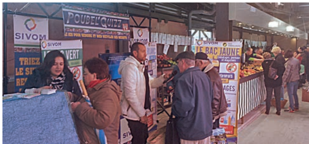
Animation Poubel'Quizz au marché.

pots à crayons. Le SIVOM a poursuivi sa mission d'information auprès du public sur les questions du tri en général et des collectes. Il a également diffusé des