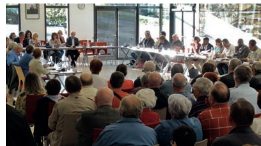
Le 13 avril plus de 150 Combs-la-Villais étaient présents à la séance exceptionnelle du Conseil municipal pour débattre du sujet.

La participation est ouverte à tous les Combs-la-Villais électeurs de la commune ou majeurs justifiant qu'ils y habitent. Il suffit de vous présenter le 3 mai entre 9h et 17h dans votre bureau de vote habituel ou le 4 mai de 15h à 20h