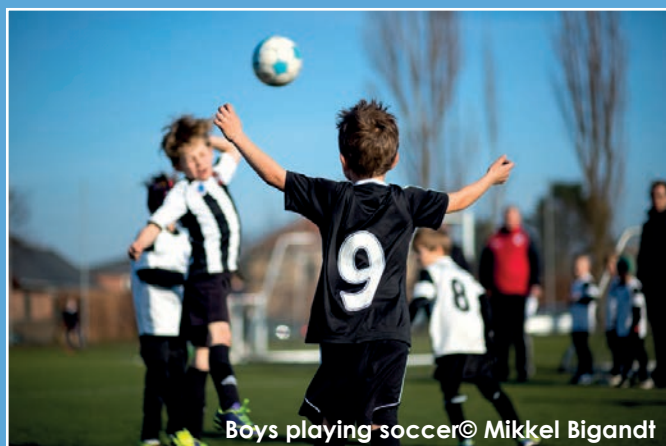
Boys playing soccer

Qu'il s'agisse de danse ou de natation, de football ou de karaté, les effets positifs du sport sur les jeunes ne sont plus à démontrer. L'activité physique est nécessaire parce qu'un enfant a besoin de bouger. Il suffit de regarder comment les jeunes courent pendant la récré ou dans la rue ! Ils ont de l'énergie à revendre et l'avantage du sport est de permettre un développement harmonieux du corps. Sans compter qu'avec la progression de l'obésité, il est toujours bienvenu de se dépenser plutôt que de rester devant la télévision.