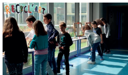
4 élèves ont présenté leur travail aux classes de CM2 de l'école de l'Orée du Bois venus visiter l'exposition le 17 avril. En mai, ils iront montrer leur exposition à l'école des Quincarnelles».