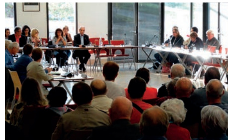
Lors de la séance exceptionnelle du Conseil municipal du 13 avril 2015 sur les enjeux de la future agglomération.

Car les 8 Maires de Sénart, réunis le 10 avril, ont à nouveau exprimé leur volonté commune de refuser ce projet au profit d'une dérogation qui nous serait accordée, comme elle l'a été si facilement aux communes de l'agglomération de Melun, afin de poursuivre d'ici 2020, terme du mandat que vous nous avez confié, tous les contacts utiles et nécessaires avec l'Etat et toutes les agglomérations voisines dans l'optique d'un éventuel regroupement