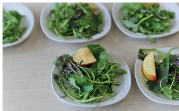
Une animation proposée par un fournisseur leur a aussi permis de déguster une salade de pourpier, roquette, pomme et mesclun entièrement bio.

Le mouvement s'est accéléré avec la réforme du service public de restauration scolaire votée par le Conseil Régional le