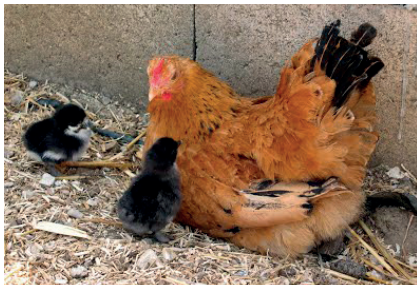
La poule, le coq, les poussins, les habitants de Fermembul

Jeudi 9 juillet 2015 une sortie en famille à la Mini ferme Fermembul de 9h15 à 14h en covoiturage. Sortie pour les enfants jusqu'à 8 ans. Pique-nique apporté par les familles. Tarif public : 3,30€ pour les adultes, 2€ pour les enfants.