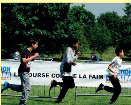
Le vendredi 22 mai, les collégiens des Aulnes ont participé activement à la course contre la faim.