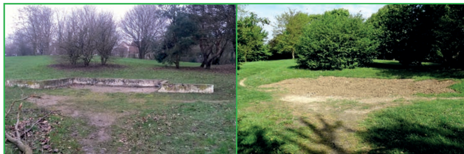
Quartier Prévert : avant / après : réaménagement d'une butte dans le parc central

Les conseils de quartier vont se réunir à nouveau prochainement, n'hésitez pas à venir y assister, les séances sont publiques. Pour garantir l'efficacité des débats, le public ne peut poser des questions qu'à la fin de la séance et à condition qu'elles ne portent pas sur des sujets déjà abordés dans l'ordre du jour. Ceux qui le souhaitent peuvent aussi recevoir automatiquement par mail les comptes-rendus des conseils de quartier,