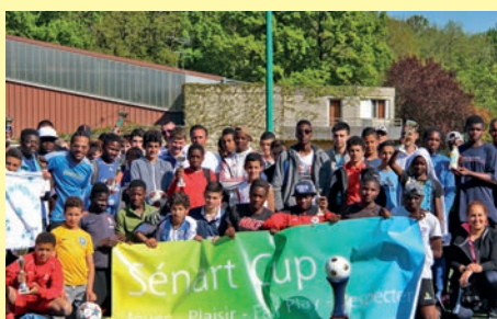
A l'initiative du service jeunesse de Combs-la-Ville plus particulièrement de L'Elan 11-15 ans, la Sénart Cup (tournoi de foot) s'est déroulée au stade Alain Mimoun lors des vacances de printemps.