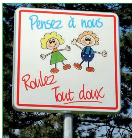
Attention aux enfants aux abords des écoles !

Dans toute la ville des panneaux appelant à la vigilance des automobilistes aux abords des écoles ont été installés par les services Techniques. C'est l'affaire de tous. Soyons vigilants.