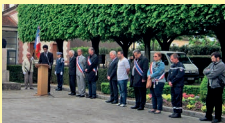
Le 26 avril 2015 avait lieu le rassemblement en mémoire des victimes et héros de la déportation.