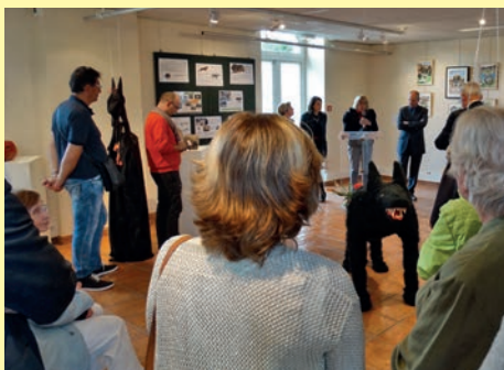
Lors de l'inauguration de l'exposition «c'est nous les loups» le 22 mai 2015.