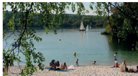
La base de loisirs de Jablines accueille chaque été des milliers de visiteurs

Mardi 28 juillet 2015 : Pique-nique intergénérationnel, parc de la