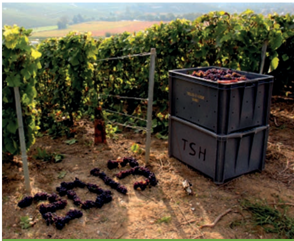
Les vignes du champagne Charlier

service Seniors au Pôle social. Tarif : 46.5€ par personne. Renseignements 01 64 13 45 28.