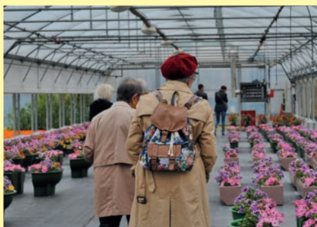
Les serres municipales ont ouvert leurs portes au public le 16 mai 2015.