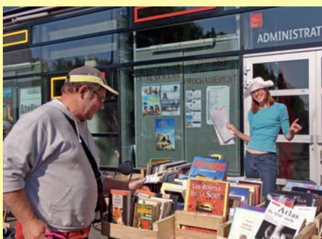
C'est sous un soleil éclatant que s'est déroulée la braderie le 17 mai 2015.