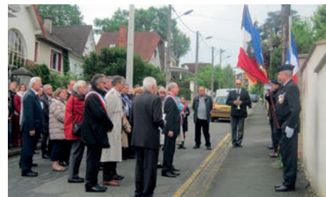
Cérémonie du 8 mai

Et, le 28 mai, à mon initiative et à celle de quelques autres, la Commission Départementale de Coopération Intercommunale a dû ajourner ses travaux devant le refus du Préfet de soumettre au vote un vœu dénonçant le