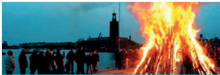
Le feu sur Riddarholmen, lors de la nuit de Walpurgis

Une délégation de notre ville se trouvait précisément à cette date en visite dans le Harz, avec nos amis de Duderstadt, dans