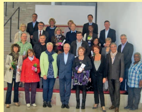
La cérémonie de remise des diplômes des médailles d'honneur du travail a eu lieu le lundi 4 mai.