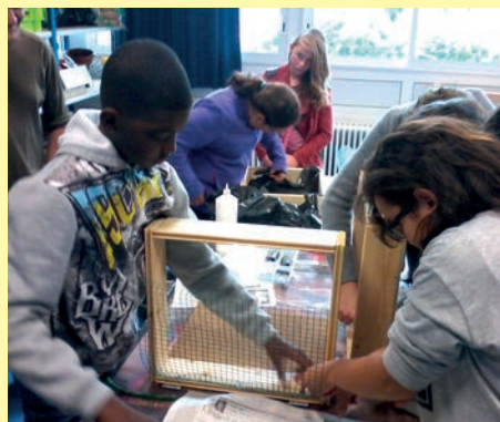
Les ados de l'Élan 11-14 ans ont apprécié l'intervention de la Maison de l'Environnement de Sénart et du service Développement Durable du 21 octobre 2015 lors de laquelle ils ont pu fabriquer un lombricomposteur.