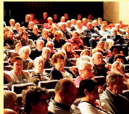
Salle comble et public enthousiaste pour l'ouverture de la semaine bleue le 12 octobre 2015 avec la projection du film Marguerite et une Catherine Frot exceptionnelle.