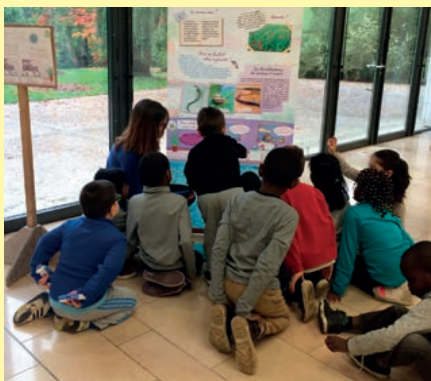
L'exposition Sous nos pieds, la terre la vie qui avait lieu du 12 au 16 octobre 2015 a remporté un vif succès auprès des écoliers avec pas moins de 250 enfants des classes de CE1 et CE2.