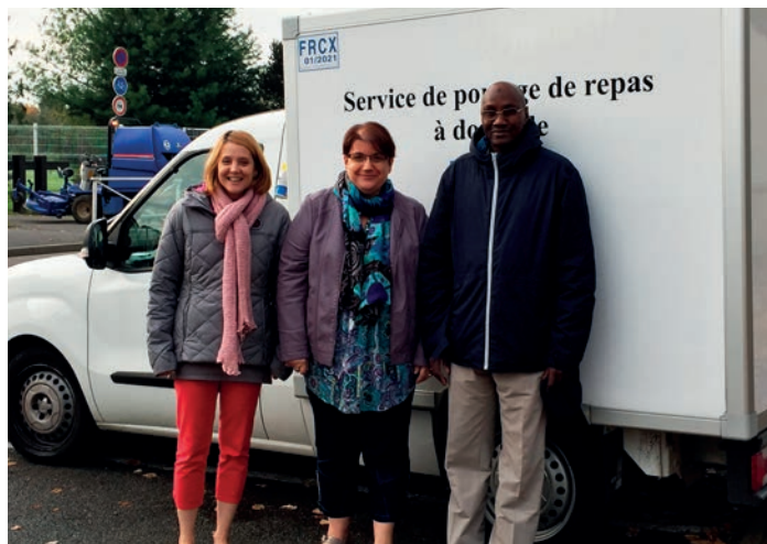
Ces trois agents sont également chargés de la livraison des repas. Ces repas sont transportés dans un véhicule frigorifique dans des glacières individuelles et sont généralement livrés à domicile entre 9h et 12h.

Le service de portage de repas s'emploie à fournir chaque jour de la semaine aux personnes fragilisées qui en font la demande un repas complet et équilibré.