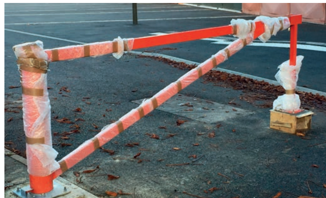
L'esplanade du marché est enfin protégée du stationnement intempestif des voitures. Des barrières levantes ou pivotantes ont été installées afin de faciliter l'installation des commerçants les jours de marché tout en protégeant l'esplanade les autres jours.