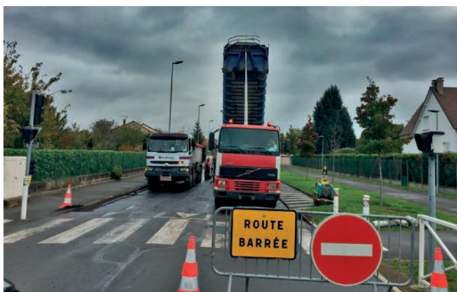
Durant les vacances de la Toussaint les rues Jean-François Millet, Jean Moulin et Pablo Picasso et le parking de l'entrée de la rue de la Thérouvanne ont été rénovés. Coût total : 250 000 euros