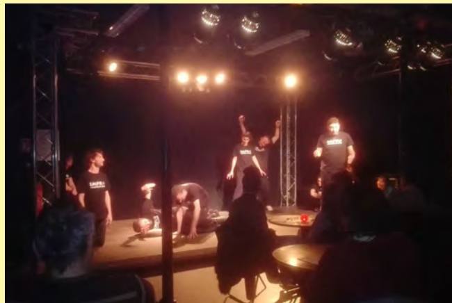
Scène humour du 26 janvier 2018 un partenariat entre la MJC et le service Jeunesse.