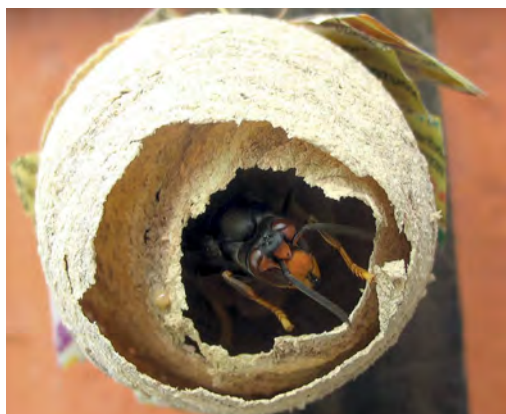
Le nid primaire d'un frelon asiatique

Ces nids ont été dans un premier temps gazés à l'aide d'un pistolet à air comprimé qui permet d'y envoyer