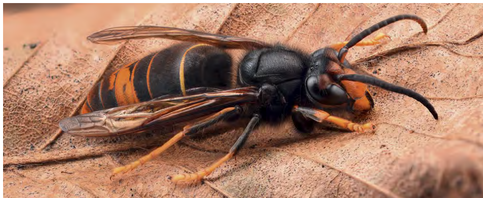
Le frelon asiatique

Dans le cadre de la lutte contre le développement du frelon asiatique sur la commune, et pour encourager les habitants à intervenir sur leur propriété privée, le Maire vient de prendre un arrêté. Celui-ci a notamment pour but de vous expliquer la procédure de mise en œuvre.