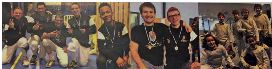
Les compétiteurs d'escrime

Championnats départementaux : le Cercle d'escrime ramène plusieurs titres, médailles et réalise un doublé historique !