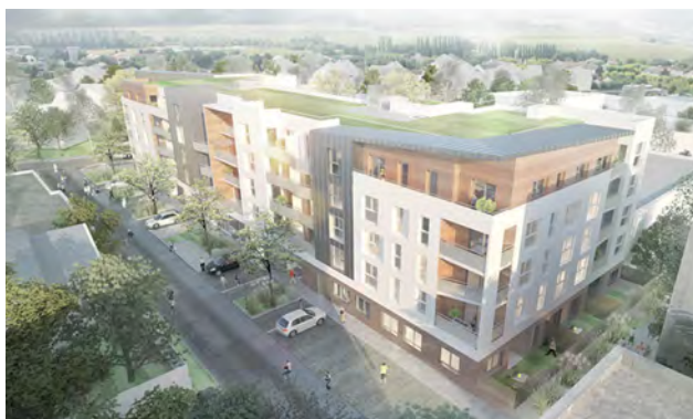
Perspective - Cabinet Riff ArchitectureS

Les nouveaux combs-la-villais qui intégreront ce quartier situé au cœur de la ville jouiront ainsi de la proximité de l'ensemble des services publics implantés sur ce secteur : complexe