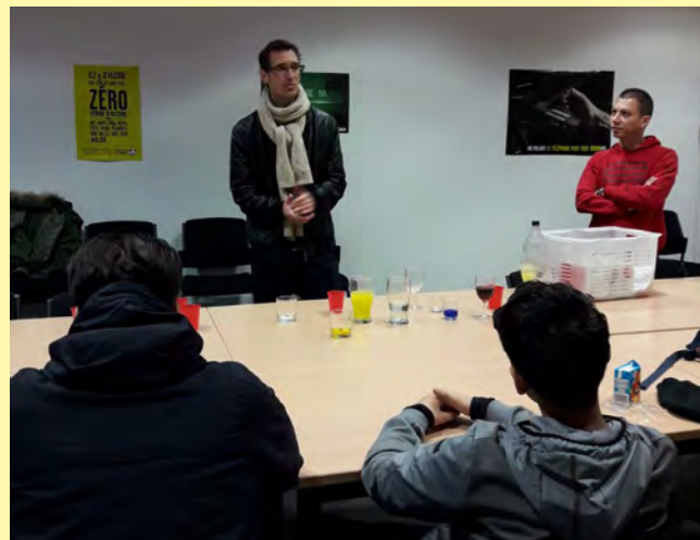
Le PIJ, en partenariat avec les accueils de loisirs Jeunesse, le service Prévention ainsi que la Croix rouge, est intervenu au sein du lycée des métiers Jacques Prévert afin de sensibiliser les jeunes de première sur les risques en matière de sécurité routière et de consommation d'alcool et de cannabis.