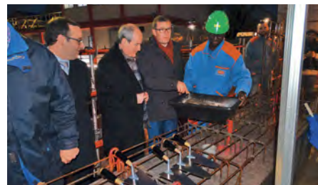
Lors de la pose de la première pierre rue Pablo Picasso avec l'OPH77.

Pendant ce temps, le déploiement de la fibre se poursuit sur la commune et nos partenaires de SFR ont ainsi pu nous confirmer en janvier que le réseau enterré était quasi entièrement