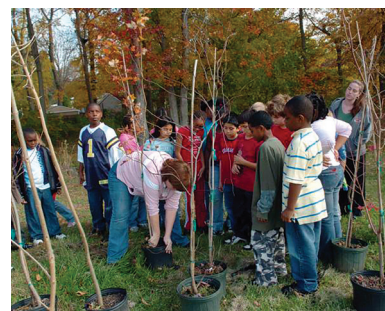
↑ La plantation un moment pédagogique

Deux espaces dans le parc central ont été retenus pour installer ces